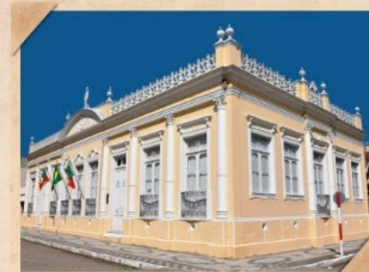
Museu Dr. Carlos Barbosa Gonçalves